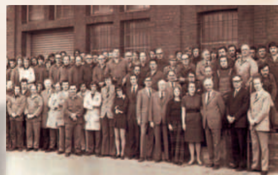
Mitarbeiter/innen des damaligen Lynenwerks aus dem Jahr 1972.