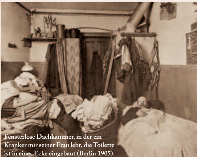
Fensterlose Dachkammer, in der ein Kranker mit seiner Frau lebt, die Toilette ist in einer Ecke eingebaut (Berlin 1905).