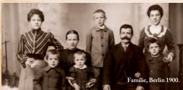
Familie, Berlin 1900.