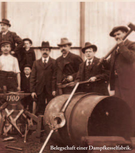
Belegschaft einer Dampfkesselfabrik.

Für die Zukunft gilt es, weiter am Ausbau von Präventionsmaßnahmen und Gesundheitsaufklärung im Sinne der Krankheitsvermeidung zu arbeiten – gemäß dem Ausspruch: „Die kostengünstigste Krankheit ist diejenige, die gar nicht erst ausbricht.“